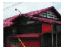
青森カラフルトタン

拝啓 時下ますますご清祥のこととお慶び申し上げます。思えば、当機構現会長である私が5月の連休に職場の先輩を「今話題の青森県立美術館、見にいきましょうよ～」とすっかり誘ったのが始まりでした。じつは美術館のオープンが7月…。それを知らずに青森に行った私が図らずも出会ったのが 雪国トタン屋根の美しさでありました。